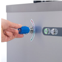
Speed adjustment tap