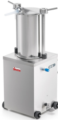
Sirman Pousoirs , modèle IS 25 Idra :

Simplets et fonctionnels, les nouveaux pousoirs hydrauliques verticaux IDRA se basent sur une puissante installation hydraulique avec une pression de 120 bars.