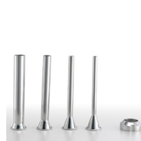
Optionals funnels and bush in stainless steel (ø 13-16-20-25-28-38)