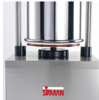
Hermetic hydraulic piston gasket