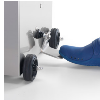
Piston pushing up