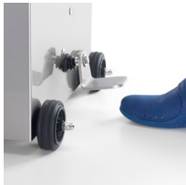
Automatic piston return